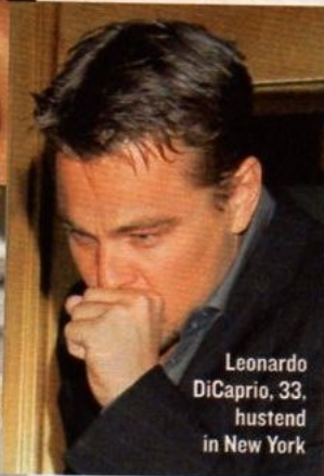
Leonardo DiCaprio, 33, hustend in New York